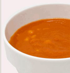
Tomatencremesuppe mit Muschelnudeln