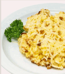
Käsespätzle "Allgäuer Art" mit Röstzwiebeln